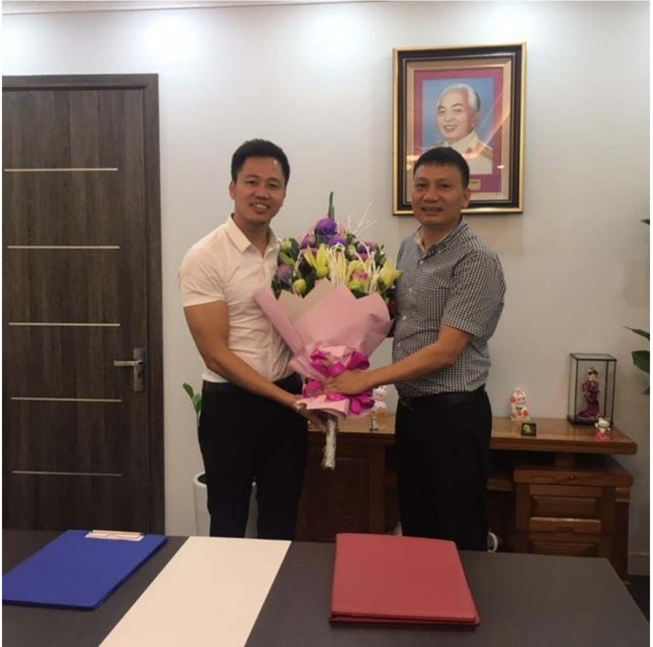
(Signing ceremony on joint cooperation between Quang Ha Company and HPC Ha Noi manpower training)

Some pictures of cooperative signing ceremony: